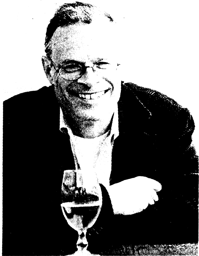
ביכולר. מרקס כחול-לבן

"ככל שהצבא האמריקני הסתבך בווייטנאם, כך הלך מעמדה של ישראל והתחזק. בשנת 1966 מכרה ארצות הברית לישראל לראשונה נשק התקפי כבד - טנקים, מטוסים וטילים. הנתונים שלי מראים שבכל פעם שהכנסותיה של ארצות הברית ממכירת נשק ירדו, פרצה מלחמה במזרח התיכון. כך היה ב'67', כשהצבא הישראלי נאלץ להכות לאור ירוק מראש הסייאיאי כדי לפתוח במלחמה. אחרי המלחמה, הלך מירוץ החימוש במזרח התיכון וצבר תאוצה, והגיע לשיאו בשנים שלפני מלחמת יום כיפור. המלחמה הזאת הביאה לקפיצה ענקית בהכנסות מנפט ובמקביל הפכה את המזרח התיכון לאזור המרכזי של יבוא הנשק בעולם. גם אם יש להניח שקיסינג'ר וניקסון לא קידמו בברכה את המלחמה, אין ספק שהם ידעו מראש על ההכנות לקראתה ולא היו מופתי עים כשהיא פרצה. מאז שנות השמונים כל הפוליטיקאים שהיו מעורבים בעסקי הנשק שינו פאזה ועברו לתמוך בשלום, אז למה ללכת רחוק?".